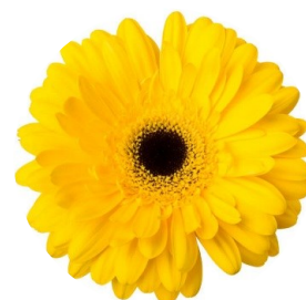
Simone Bruyland - 6 april